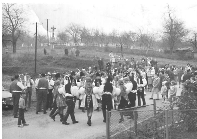
Pohled na kříž v druhé polovině minulého století