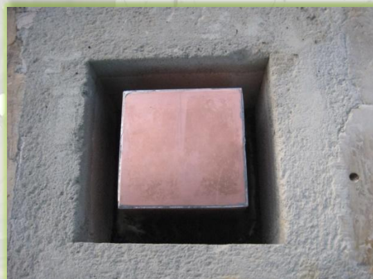
Měděná schránka v základu obsahuje aktuality z dění v obci