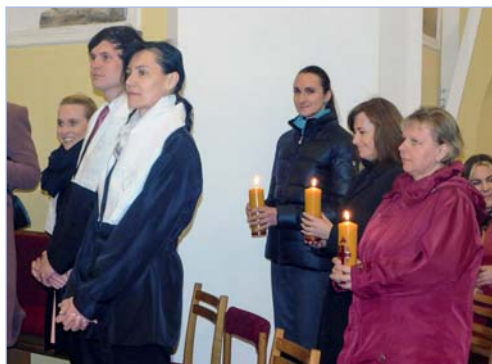
Nově pokřtění s kmotry

Děkujeme za rozhovor a přejeme mnoho Božího požehnání a trvalé odhodlání žít nový život s Ježíšem.