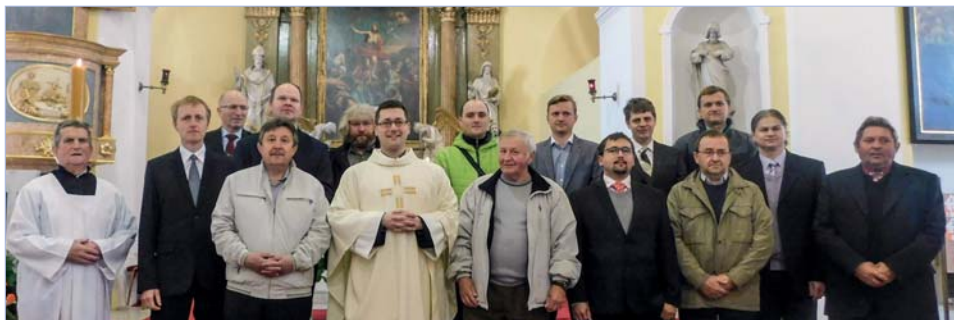
Společné foto s bývalými ministranty

Další fotografie z uvedených a jiných akcí najdete vždy na webových stránkách naší farnosti: www.farnostbilovice.cz v sekci fotogalerie.