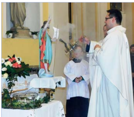
Velikonoční vigilie 15. 4. 2017 v Bílovicích spojená s udílením křtu katechumenům