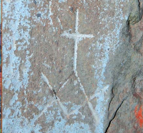
Gotické okno z 2. poloviny 14. století Nejstarší zobrazení kostela z r. 1870 Kamenická značka nalezená na okně