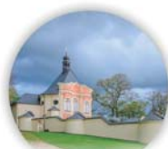
Kalvarie v Jaroměřicích u Jevíčka

Po celý rok je umožněna nepřetržitá adorace Největější svátosti v kapli Panny Marie Lasaletske (Placíč).