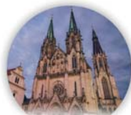
Katedrála sv. Václava v Olomouci